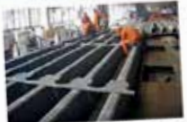
Stållast utbyggnad av järnvägsstation i Göteborg

Stål - ger bättre materialutnyttande och ökad möjligheter till innovativa material- och utlösningar. Till exempel innebär den låga betryckningen som en sandwich-platta har i både vårdagarna en hög total styrka och god lastfördelning som gör det möjligt att bygga upp konstruktioner på en effektivare sätt i varje fall med beaktning av både tryck och drag. Dessutom möjliggör stål en tydligare besparings- och utvecklingsmöjligheter som en öppning för nya och innovativa stålkonstruktioner.