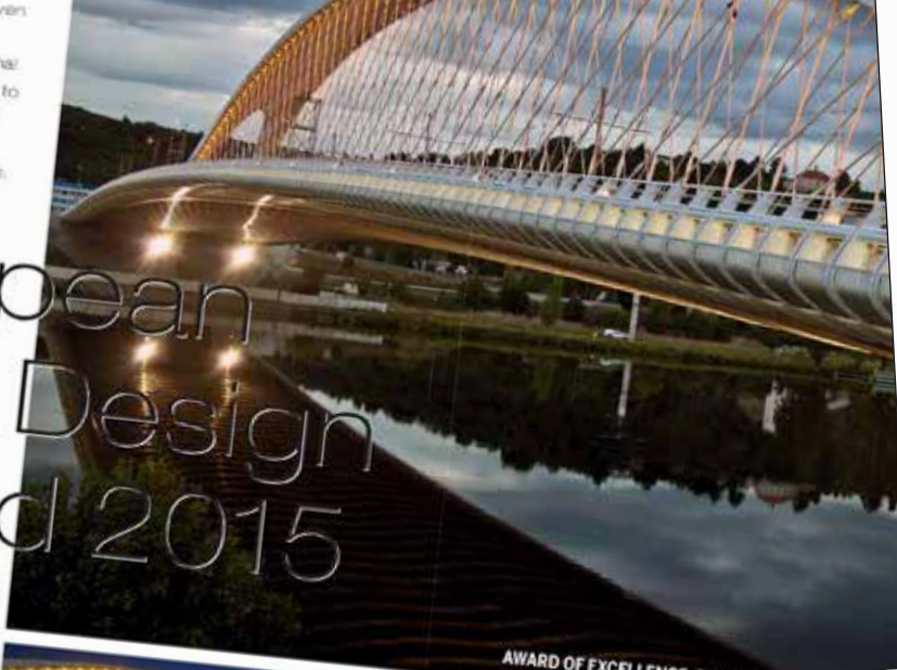
AWARD OF EXCELLENCE, BRIDGE

Steel offers new solutions and opportunities, allowing architects and engineers to stretch their imaginations and actually create more of the things they long for: structures, formwork, steel in floor, strength, durability, design flexibility, adaptability in building construction. Within the European Steel Award, the most outstanding European projects are listed and brought to the larger international audience.